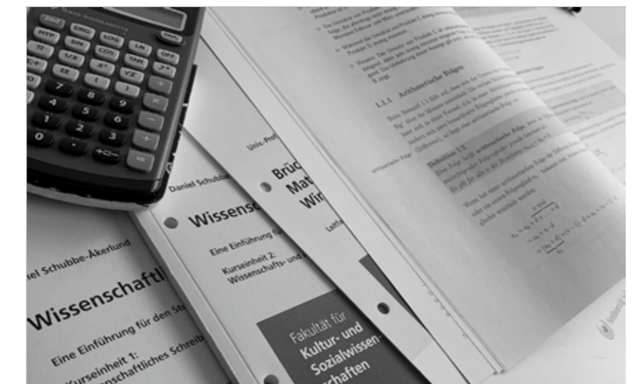
Verschiedene Fakultäten und Themenbereiche.

Seit 2000 nimmt das SMC in Saalfelden bereits an EU-Projekten teil. Am 20.1.2020 wurden zwei neue Erasmus+ Projekte gestartet. Eines dieser Projekte nennt sich „DigiCULTS“ - Digitale Kultur für Klein- und Mittelunternehmen (KMUs). In diesem zweijährigen Projekt geht es um die Entwicklung der Digitalisierung in der Gesellschaft. Darin werden Online-Kurse zur Anwendung für Betriebe und deren Mitarbeiter erarbeitet.